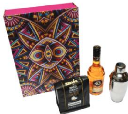
Kit De Carajillo $1,100.00