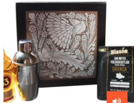
Kit De Carajillo De Lujo $1,800.00