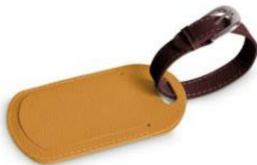
Dos Tags De Maleta De Piel $650.00