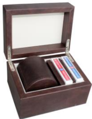
Cubilete De Piel Con Brocado $1,300.00